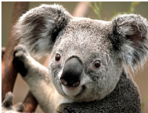
Grafik 1. Naziv grafika ( centrirano )